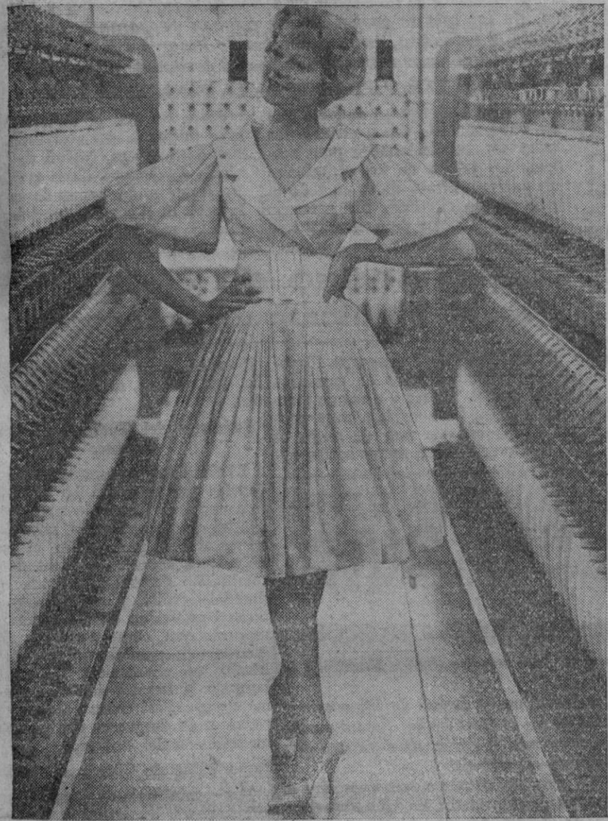
En esta fotografía se ven telas de nylon en su punto de origen. En una importante fábrica británica de hilados de nylon, este vestido para día se confecciona en un nuevo género de dicha fibra artificial: en shantung Ban-Lon azul pálido estampado con puntos. El vestido es liviano y lavable, pero, sin embargo, es lo suficiente opaco para usarlo de día. El nylon, una de las fibras que gozan de mayor aceptación para prendas de modas, se emplea abundantemente en las últimas creaciones. Las casas principales exhiben colecciones de vestidos para día y separados, abrigos y trajes ligeros, vestidos para "party" y de baile, ropa blanca y trajes de baño