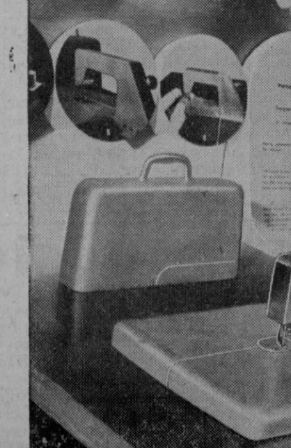
Un nuevo tipo de máquina de coser eléctrica y portable, diseñada por los señores Henrion y Woods