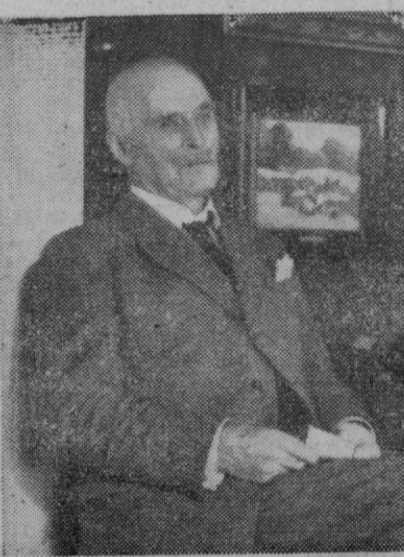
Knut Hamsun, celebre novelista noruego, que ha participado, pese a sus ochenta y cuatro años, en el Congreso Internacional de Periodistas, celebrado en Viena