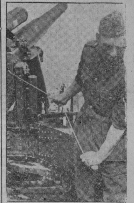
Momento en el que el jefe de una batería alemana da la voz de juego

ron tan gravemente alcanzados por los proyectiles que puede darse por segura su pérdida. Las acciones aéreas enemigas contra Trapani, puerto Empedocles y Catania han causado daños ligeros, y un corto número de