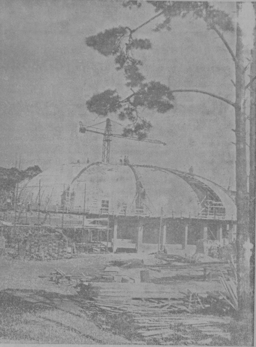
TRABAJOS PREPARATIVOS PARA LAS OLYMPIADAS 1936.—Los trabajos para la terminación del Estadio para las fiestas de las Olympiadas 1936, se están llevando a cabo con mucha intensidad en Alemania. «La Casa del Sport Alemán» con su techo ya terminado la cual ofrece un aspecto grandioso.

Hacia mediados del siglo XIX, la Astronomía adquirió gran importancia en la Universidad de Leyden. Gracias al astrónomo Kayser (1808-1872), se trasladó el antiguo Observatorio desde la parte alta de la Universidad a un nuevo edificio que ha ido experimentando posteriormente nuevas y sucesivas ampliaciones. Por ser pantanoso el sub suelo del sitio donde está el Observatorio, todas