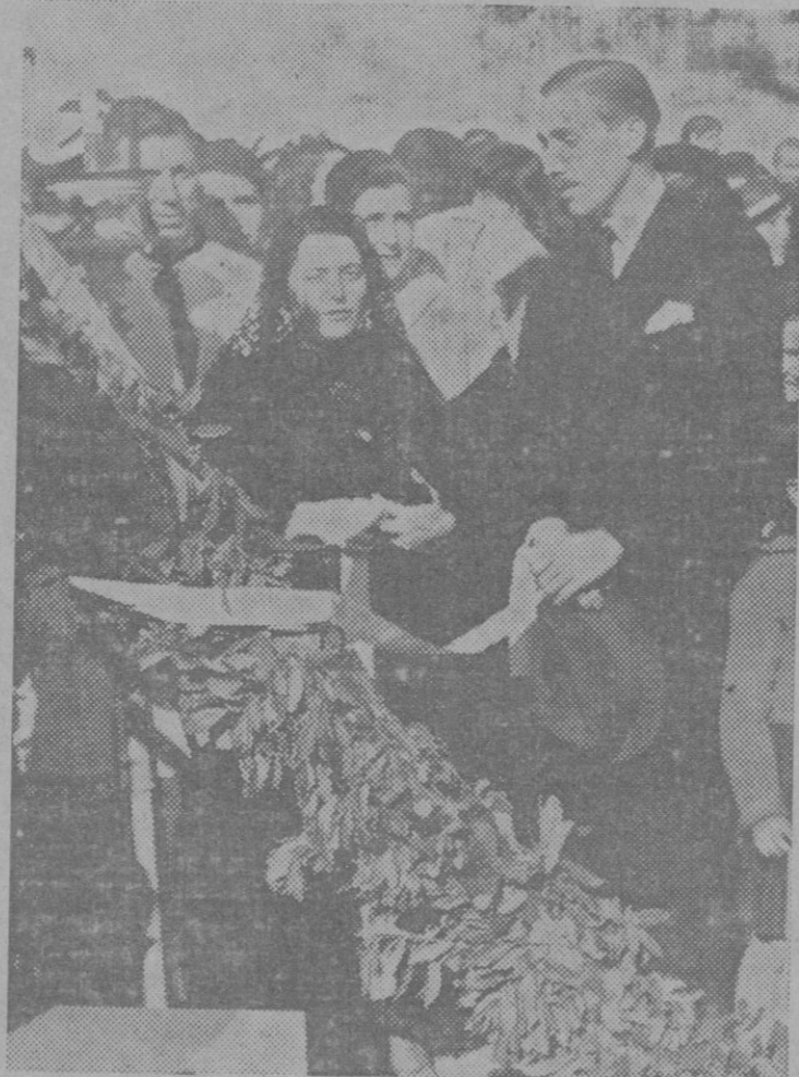
Instantáneas — de — Enrique Arbós