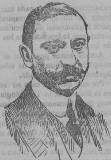
Señor Marqués de Alhucemas Presidente del Consejo de Ministros

Vea el lector que todo se ha ido cumpliendo rigurosamente y que falta solo la «ruptura diplomática.»