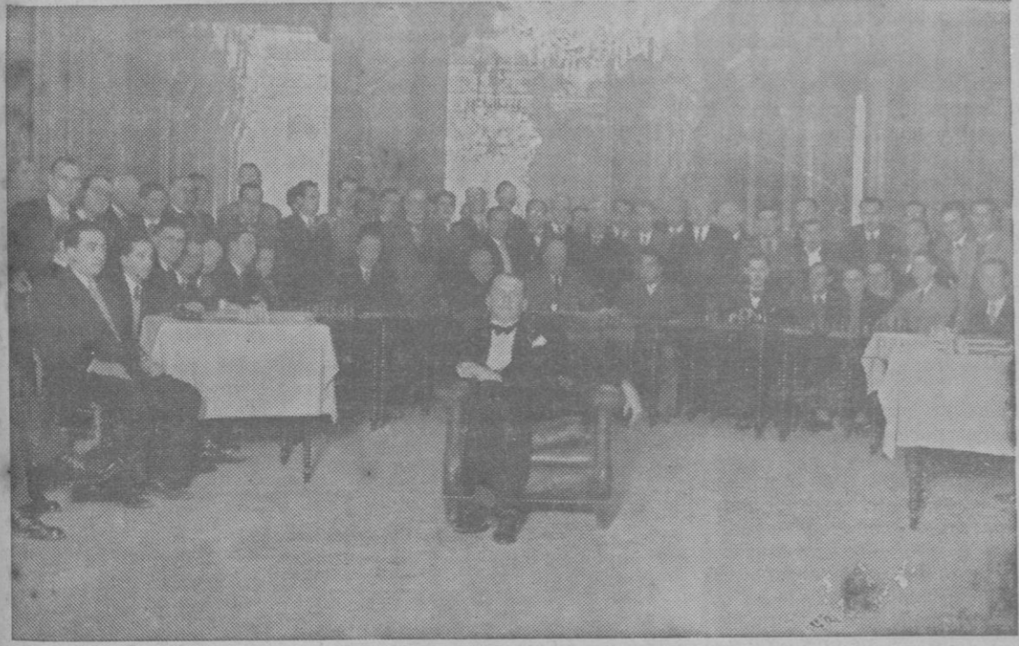
El Dr. Alekhine al dar comienzo a las diez partidas a ciegas el sábado en el Círculo Mellorquín.

Advertimos a nuestros comunicantes que toda la correspondencia relativa al periódico, debe ir dirigida a la Dirección del mismo.