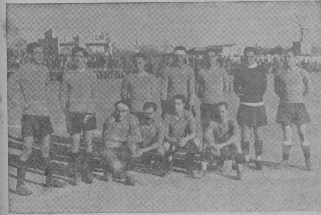
El equipo de la selección.