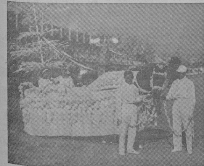
3er. PREMIO: La carroza «Camelias», ocupada por dos señoras