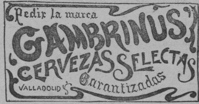
Medalla de oro.—París y Londres. 1902.

las diarreas de los niños en todas sus edades. No sólo cura, sino que obra como preventivo, impidiendo con su uso las enfermedades del tubo digestivo. Nueve años de éxitos constantes. Exijase en las etiquetas de las botellas la palabra STOMALIX, marca de fábrica registrada. De venta, Serrano, 30, farmacia, Madrid, y principales de España, Europa y América.