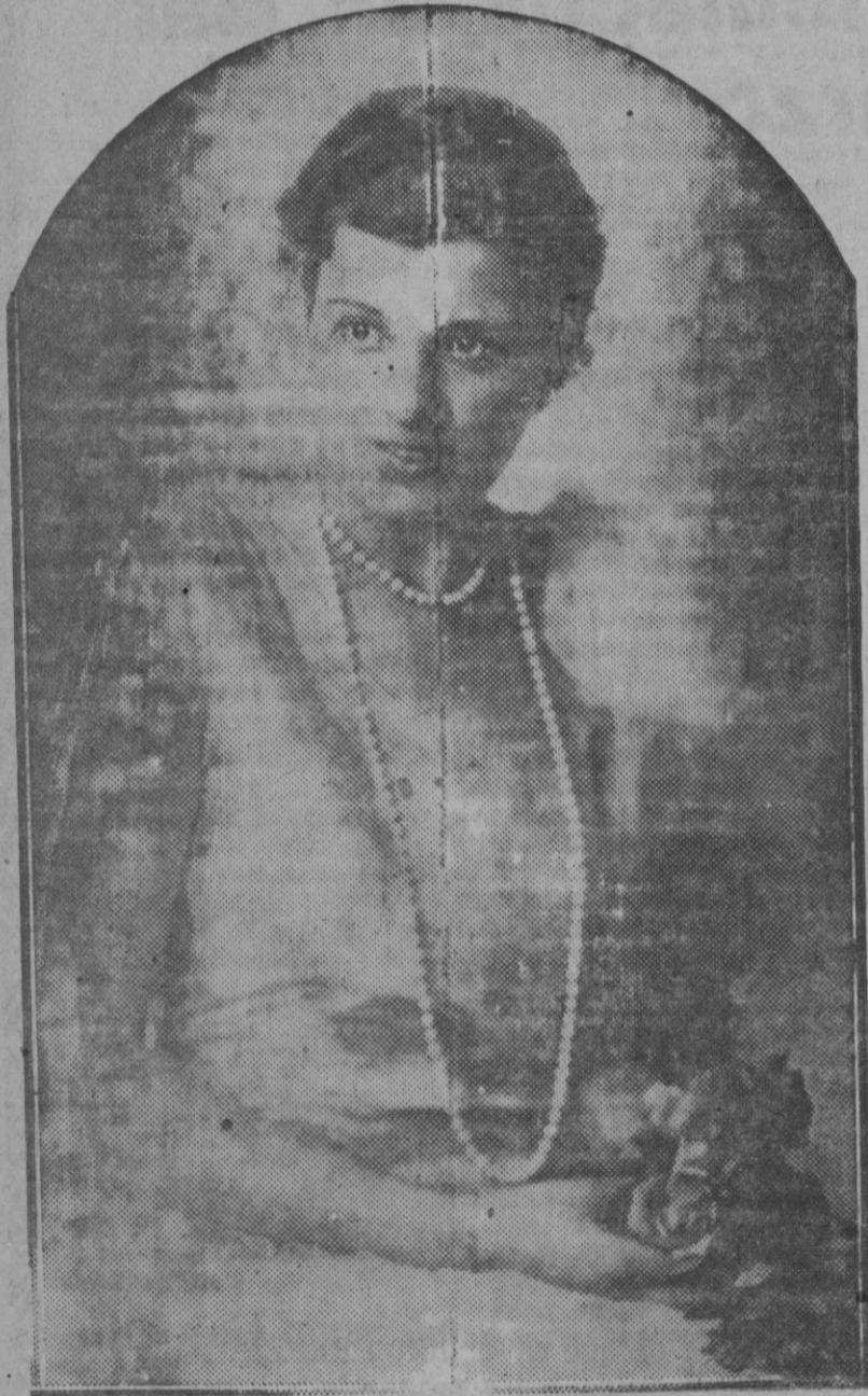
Una digna representación de Nauheim