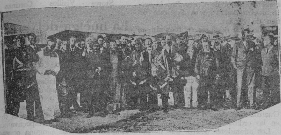
Grupo de pilotos participantes en la Copa de España, consistente en la vuelta al país sobre avioneta