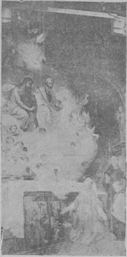
La aparición de la S. Trinidad a San Juan de la Cruz, tela pintada para la iglesia parroquial de Campos del Puerto