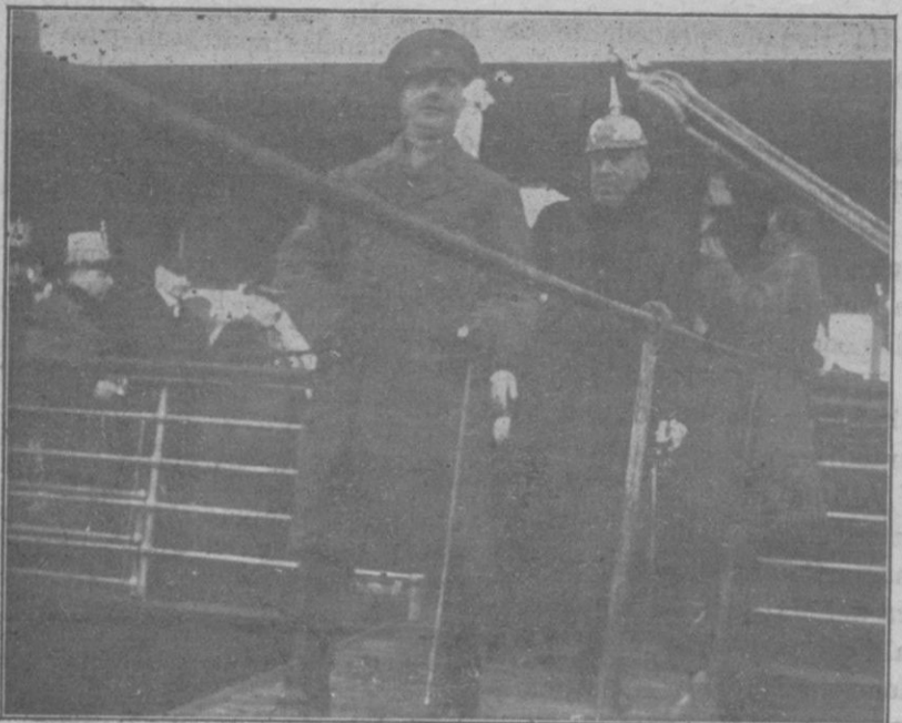
El Infante D. Fernando al bajar del vapor seguido del General Gobernador.