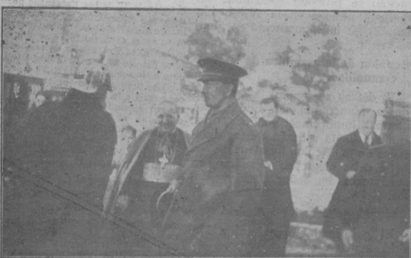
El Infante D. Fernando al llegar al Mediterraneo rodeado de Obispos de Mallorca, del General Gobernador, del Conde de Perálada, de D. Nicolás Cotoner y del Capellán del Obispo.