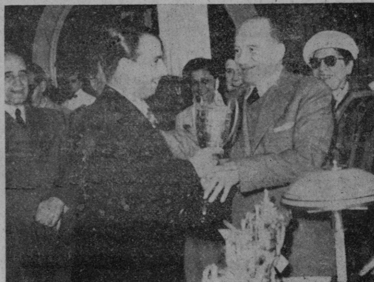
REPARTO DE PREMIOS EN EL CLUB NAUTICO. — EL CAPITAN GENERAL ENTREGA UN TROFEO AL SR. PEREZ.