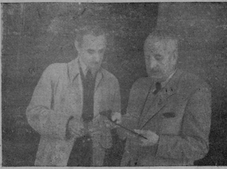
EL COMISARIO JEFE DE LA POLICIA MUESTRA A NUESTRO REDACTOR LA PISTOLA Y EL PUÑAL QUE TENIA EN SU PODER "DON SEBASTIAN"

Por fin ha sido descubierta la verdadera personalidad del malhechor. Este, además de la pistola, tenía en su poder un atilado puñal. La detenida al leer en LA ULTIMA HORA la noticia de la captura de su "esposo" se mostró más explícita. - Hasta ahora han sido detenidas ocho personas. - Es hallado un nuevo escondrijo, con objeto,