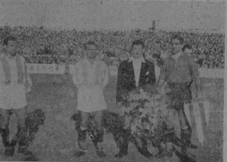
LOS DOS EQUIPOS QUE LUCHARON AYER EN SON CANALS Y LOS CAPITANES DE LOS MISMOS ANTES DE COMENZAR EL PARTIDO.

Hace tiempo que lo venimos repitiendo. La característica más acusada del Atlético Baleares de los últimos tiempos, había sido la voluntad, el entusiasmo, el tesón y la rapidez endiablada, consecuencia de aquellas cualidades, que le hicieron campeón de campeones en la temporada anterior. Incluso hemos insinuado, más o menos abiertamente, la posible conveniencia de incluir en el cuadro al mayor número posible de jugadores que el año anterior militaron en las filas blanquiazules, no por entender que su clase pudiera superar a las individualidades que constituyen el equipo actual, pero sí para devolverle aquella manera de hacer que tantos entusiasmos levantó entre sus seguidores y tantas tardes de triunfo proporcionó a los titulares de Son Canals.