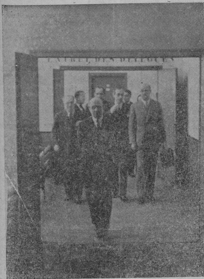
El Comité de los Trece al salir de la reunión que celebró bajo la presidencia del Delegado español, para estudiar una posible solución al conflicto italo-abisinio.