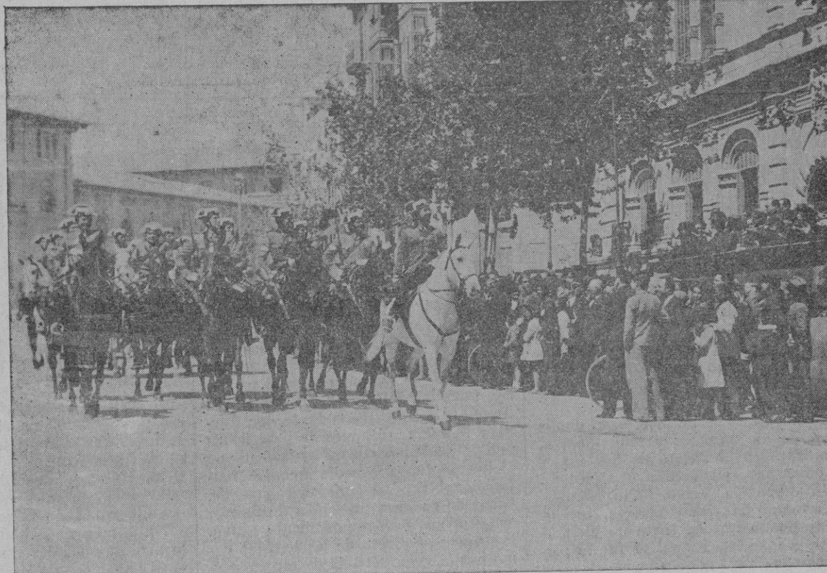
Las fuerzas montadas de la Guardia Civil, en los momentos de desfilarse ante la tribuna levantada en la continuación de la Rambla.

consumieron meriendas o almorzaron bien a la orilla del mar o a la sombra de encinas o pinos.