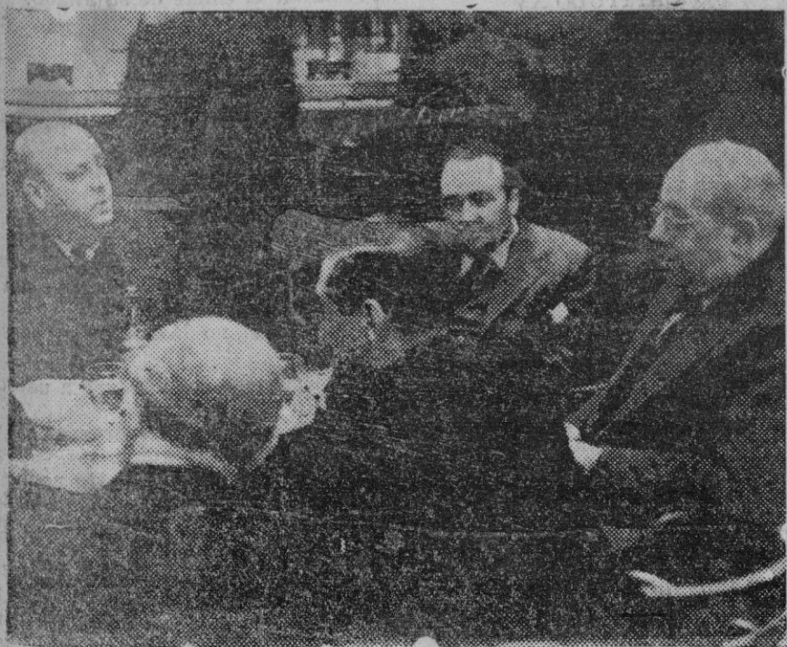
El Jefe del Gobierno Don Manuel Azaña, con Don Indalecio Prieto y otros diputados en el bar del Congreso, después del discurso que pronunció el Sr. Azaña, definiendo la política del Gobierno.