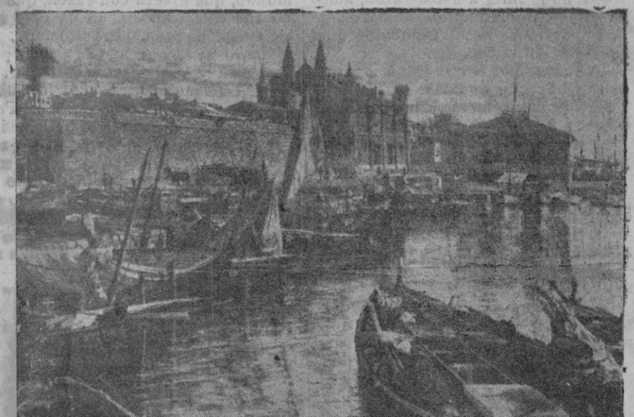
En los escaparates de los Almacenes Matheu, ha sido expuesto este óleo, original de nuestro amigo Don Juan Pallicer Enseñat. Este cuadro, pintado por encargo del Hotel Formentor, es de sumo interés, no solo por su valor artístico — es una obra de acabado dibujo y de un colorido admirable — sino por el tema que desarrolla que evoca un aspecto de la antigua ciudad, en el cual sucesivas reformas han cambiado totalmente. El baluarte de Chacón, ya derribado; la desaparecida verja que cerraba el jardín del Consulado de Mar; el muelle de la Lonja antes de su ensanche; la explanada de la Lonja sin el paseo de Sagrera; el tranvía de sangre; la vieja galera, etc., son notas evocadoras de un próximo pasado, recogidas con admirable fidelidad en este magnífico lienzo tan felizmente logrado por el amigo Pallicer, al que sinceramente felicitamos