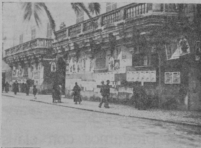
Pintoresco aspecto que esta mañana ofrecía la fachada de Ca'n Berga, de la plaza de Santa Catalina Thomás, cubierta con carteles de propaganda electoral.

Por justicia y por conveniencia pública deseáramos que fuera atendida la justa reclamación que formulan las Cámaras de la Propiedad Urbana.