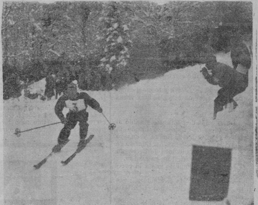
Birger Rund, noruego, que ha ganado el título de campeón de la carrera de descenso en la Olimpiada blanca que se celebra en Garmisch.

Votad esta candidatura. No deis tachar ni cambiar ningún nombre. Borrar o cambiar un nombre es votar al adversario y dar el triunfo a la Revolución.