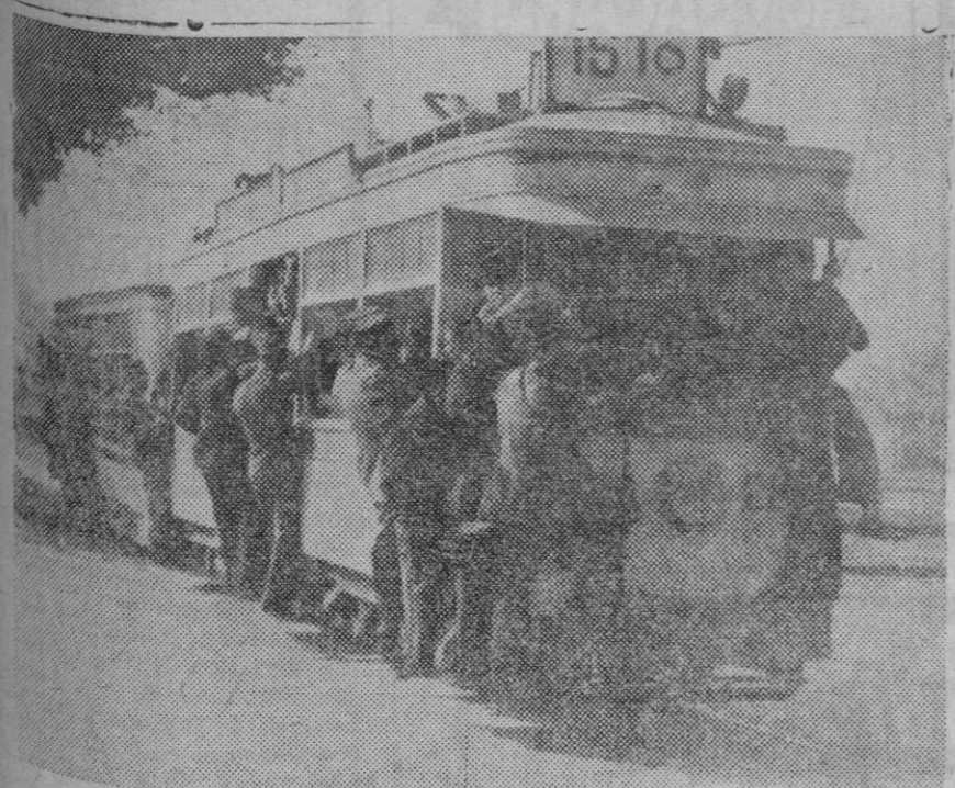
Los estudiantes de El Cairo durante los últimos disturbios, se apoderaron de los tranvías, paseándose en ellos.

Candidatura que deben votar en PALMA los electores de Centro-Derecha.