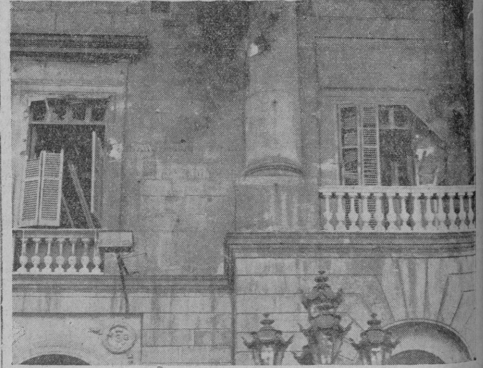
Balcones del Ayuntamiento de Barcelona, destrizados a cañonazos en la noche del 6 de Octubre.