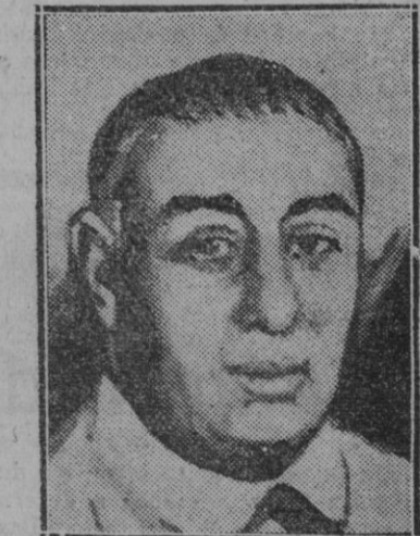
EXTRANJERO.—"Big" Bill Thompson que ha sido reelegido Alcalde de Chicago, donde goza de gran popularidad