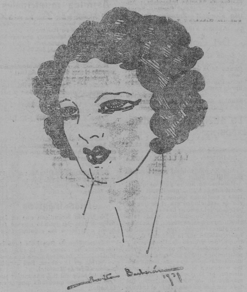
Bonito peinado a pequeños rizos, que realza en extremo la atractiva belleza de una mujer joven y morena