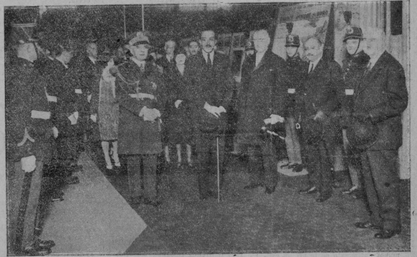
El viaje del Rey de España.—Momento de salir de París para marchar a Londres.

Milán.—El año pasado se celebró en París una Conferencia internacional, a la que asistieron representantes de cincuenta naciones, para discutir