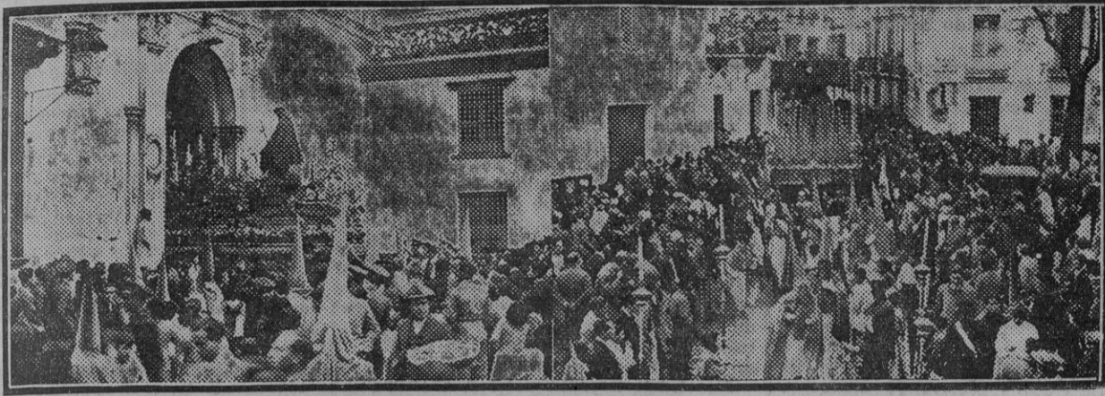
El «paso» de Nuestro Padre Jesús del Buen Viaje, de la parroquia de San Esteban, saliendo de la antigua Casa de Pilatos, en la que hubo de refugiarse á causa del temporal de lluvias, durante la estación de penitencia de la cofradía á la Catedral.—El «paso» de la Virgen de los Desamparados, de la cofradía de San Esteban—única que ayer hizo todo el recorrido—á su entrada en la plaza de Pilatos.