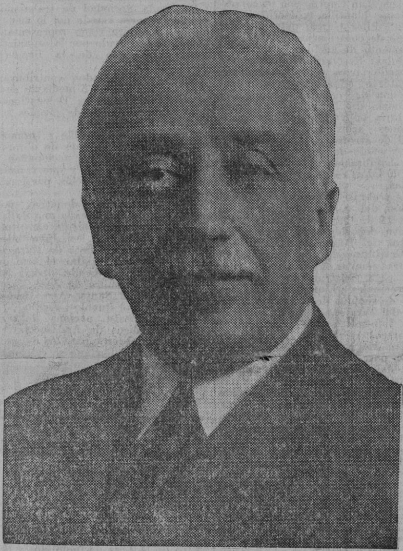
Don Niceto Alcalá Zamora, primer Presidente de la República Española, que al aprobar las Cortes la aplicación del artículo 81 de la Constitución, cuyo último párrafo dice textualmente: "En el caso de segunda disolución, el primer acto de las nuevas Cortes será examinar y resolver la necesidad del decreto de disolución de las anteriores. El voto desfavorable de la mayoría absoluta de las Cortes llevará aneja la destitución del Presidente", ha cesado en el acto en sus funciones.

La trascendencia histórica de la resolución adoptada ayer por la Cámara de los Diputados en su más alta función de soberanía, da a los comentarios de la Prensa, como órgano en que reflejan todos los elementos su opinión, un relieve excepcional.