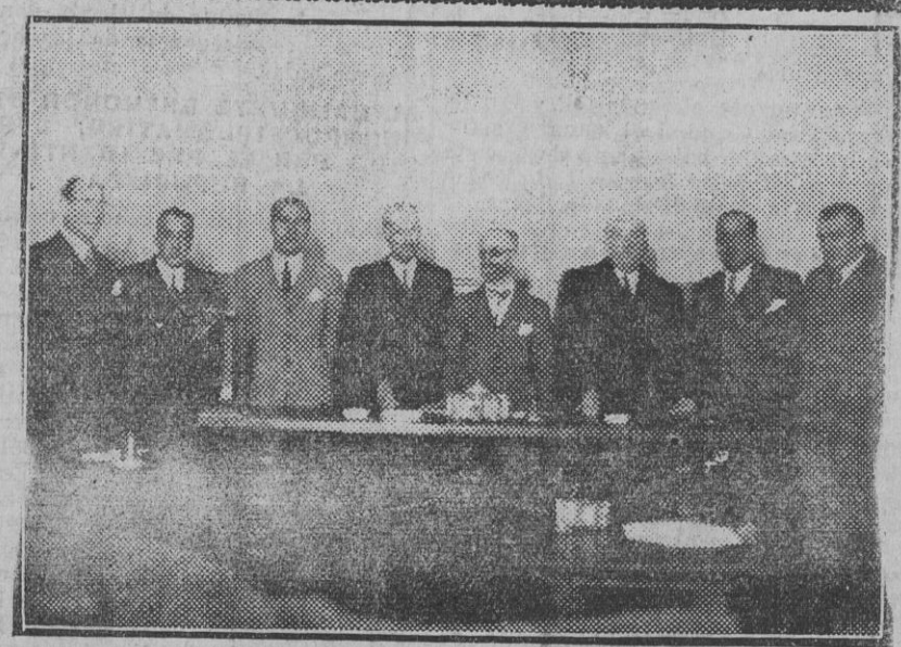
Presidencia de la sesión inaugural de la Sociedad Médica de Hospitales de Sevilla.

Oviedo 10.—El asunto de la distribución de los millones destinados por el Gobierno para reparación de los daños en Asturias parece que entra, por fin, en una fase de solución satisfactoria para los interesados. Hoy se ha sabido que en una nueva entrevista celebrada en Madrid por el señor Lerroux y don Melquíades Álvarez, el jefe del Gobierno, reiteró al señor Alvarez la promesa categórica de que en el nuevo decreto para la distribución de los sesenta millones no habrá reducciones, restricciones ni topes de ninguna clase, pagándose, por tanto, los daños previo el correspondiente informe. Particularmente sabemos que por la Auditoría de guerra se ha dictado la disolución del Sindicato minero asturiano, contra cuya entidad obrera se habían ejecutado algunos embargos en nombre de los distintos acreedores.