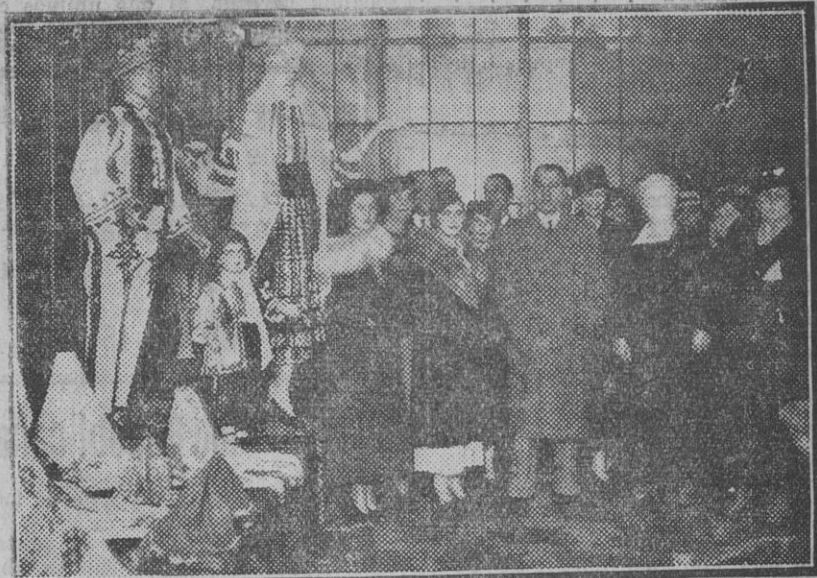
Acto Inaugural de la Exposición de Arte Popular Rumano.

Esperamos la noticia de que, al fin, los caodaístas, puestos de acuerdo y en feliz armonía, hayan podido designar al pastor de sus ovejas.