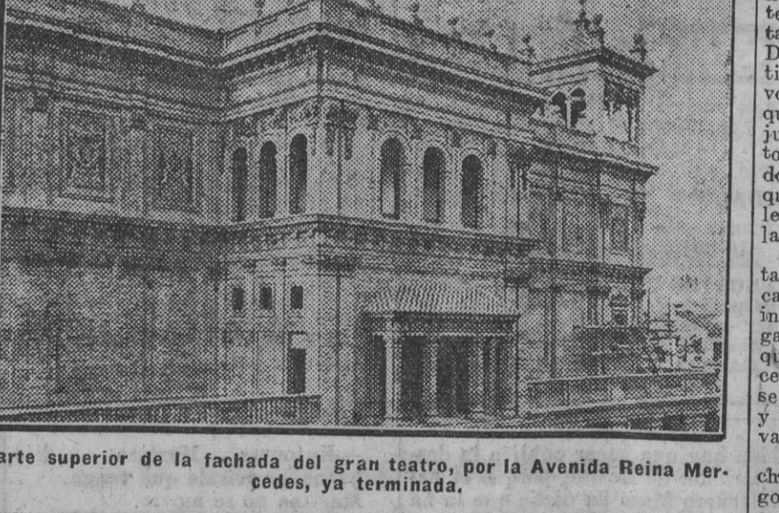
Parte superior de la fachada del gran teatro, por la Avenida Reina Mercedes, ya terminada.