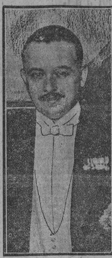
EL DUQUE DE HORNACHUELOS que el sábado último dió una brillante conferencia en el salón de actos de la Conferencia Económica acerca de «El desembarco en Alhucenas y el cráter Palos-Buenos Aires».