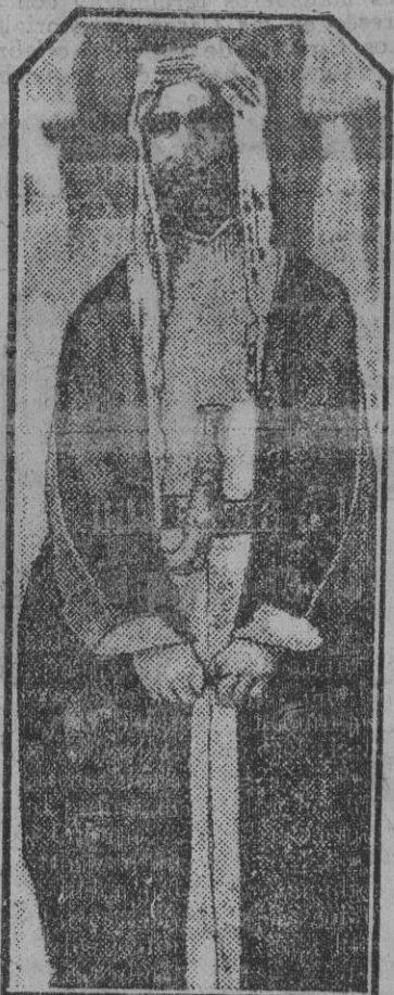
Faical, llamado rey del Irak, cuyo viaje a Londres, que se atribuye a motivos de salud, parece obedecer a otras causas.

Me he tropezado en la calle con el Si Sufi el Bakali, que fue bajá de Xauen mientras Xauen fue español.