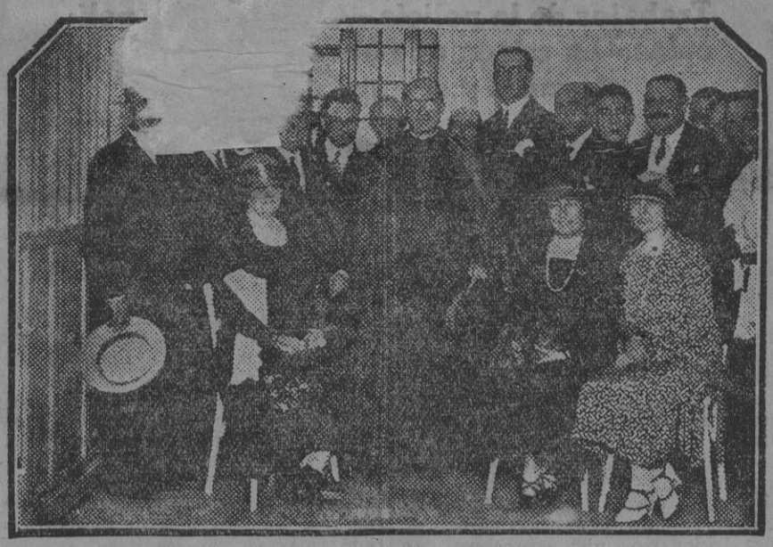
El Arzobispo, Alcalde, Gobernador, médicos, familia donante é invitados, después de la bendición de la Sala de Maternidad, verificada ayer.

El Juzgado practicó las diligencias de rigor.