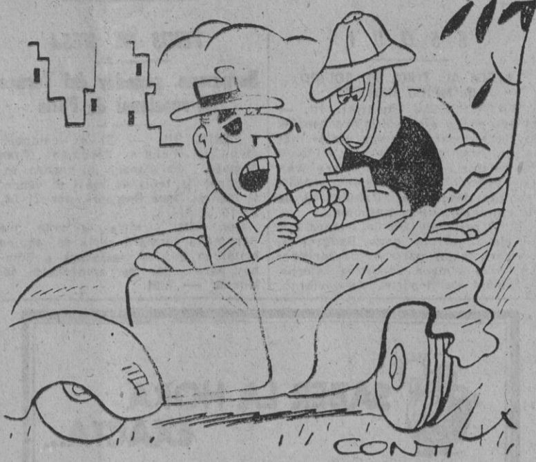
— Si, corría un poco por miedo a llegar tarde a una conferencia sobre los peligros de la circulación precipitada...