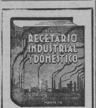
Acaba de aparecer la quinta edición ampliada y modernizada...