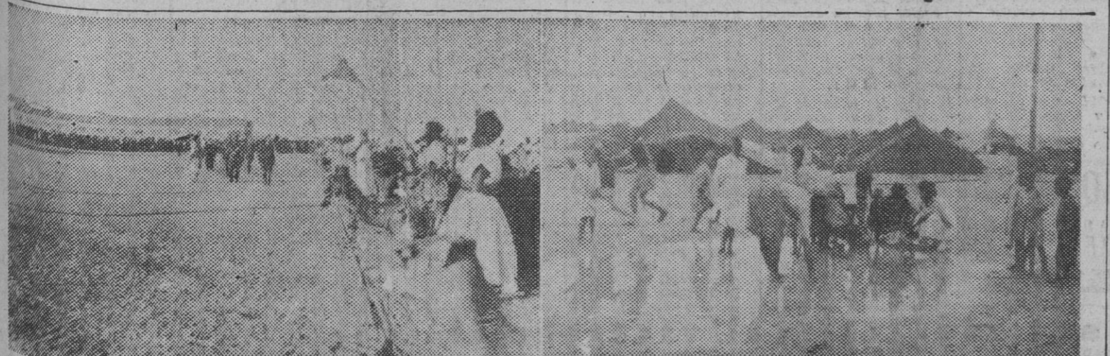
El gobernador militar del África Occidental Española, general Rosaleny, pasando revista a las fuerzas indígenas. En la foto de la derecha: Los nativos recogen el agua lluvia antes de que la resaca tierra la absorba; en estas regiones donde llueve tan de tarde en tarde, el agua tiene tanto valor como el oro.