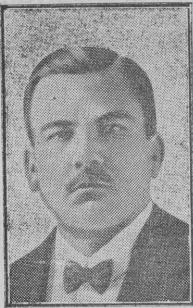
El Presidente Calles, jefe del Gobierno de México.

Los films más o menos largos están guardados en cajas de latón cuadradas, de una longitud uniforme de cuarenta centímetros. En total existen ciento cincuenta mil metros de películas en las que aparecen Clemenceau