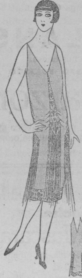
TRAJE DE NOCHE.—Traje de lamé, oro bordado de strass y franjas de oro.