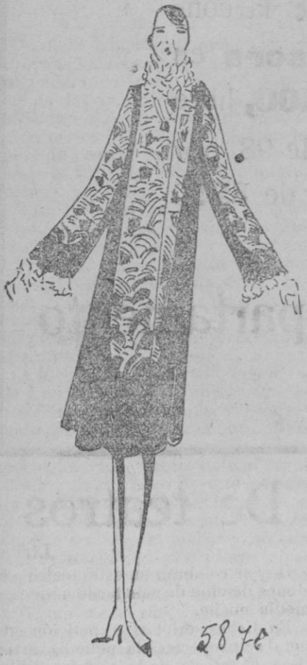
ABRIGO.—Abrigo «Rialto» de terciopelo negro y crepé satén, trenzado sombreado. Cuello y adornos en bonita imitación de hermina.