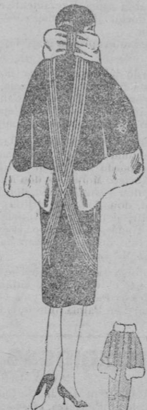
ABRIGO CAPA.—Abrigo de terciopelo zafiro, trenzas de plata. Piel de conejo blanco.