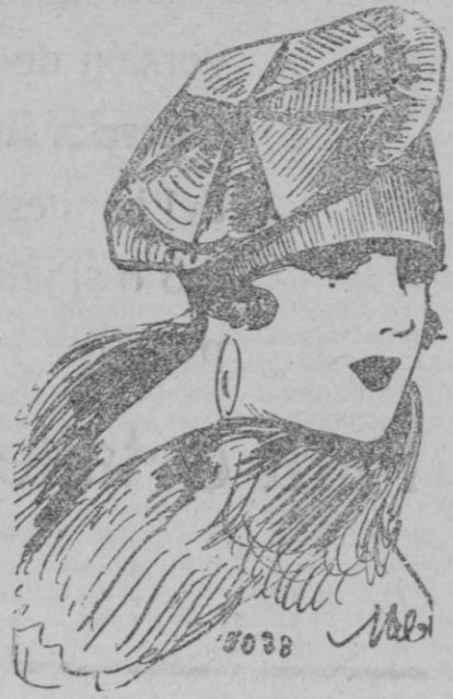
SOMBRERO.—Sombrero de ottoman oxidado formando por un prodigioso trabajo de cinta una flor estilizada. (Flora & Marguerite).

Los sombreros han variado, con gran perjuicio de las modistas y por culpa de ellas mismas, así numerosas mujeres los utilizarán durante varias temporadas. Con esos bonetes sin adorno las modistas se ven así privadas de todos los elementos encantadores; flores, plumas, frutos. La calota sube o baja, el borde sigue siendo estrecho, el sombrero pequeño, la forma no cambia, las modistas se han encerrado ellas mismas en un dilema, pero he aquí que los joyeros toman la ofensiva. Se vuelve al sombrero de Carlos XII, adornado con una sola joya, onyx o diamante, lo cual permite a los sombreros, a los fieltros, el costar 1000 francos... en casa del joyero.