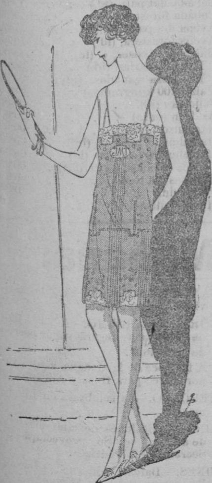
CAMISA-PANTALON.—Presentamos en esta figura una camisa-pantalón. Es de tela de seda verde de jaspe, adornada con pliegues de diferentes alturas. Un ancho calado escalera forma dientes orlando el encaje de Valenciennes, subrayando el largo corsete funata.

El traje forro se lleva cada vez más, para sacarle la rigidez y la estrechez, se drapea en el bajo con volantes festoneados, con bandas, plie-