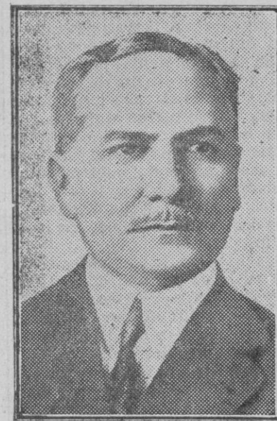
El Presidente Diaz, jefe del Gobierno de Nicaragua.

Pero los que adquieren más esta clase de películas son los melleurs en scene para intercalar pasajes de bombardeos o evacuación de heridos, servicios sanitarios, etc. en films de episodios o de aventuras.