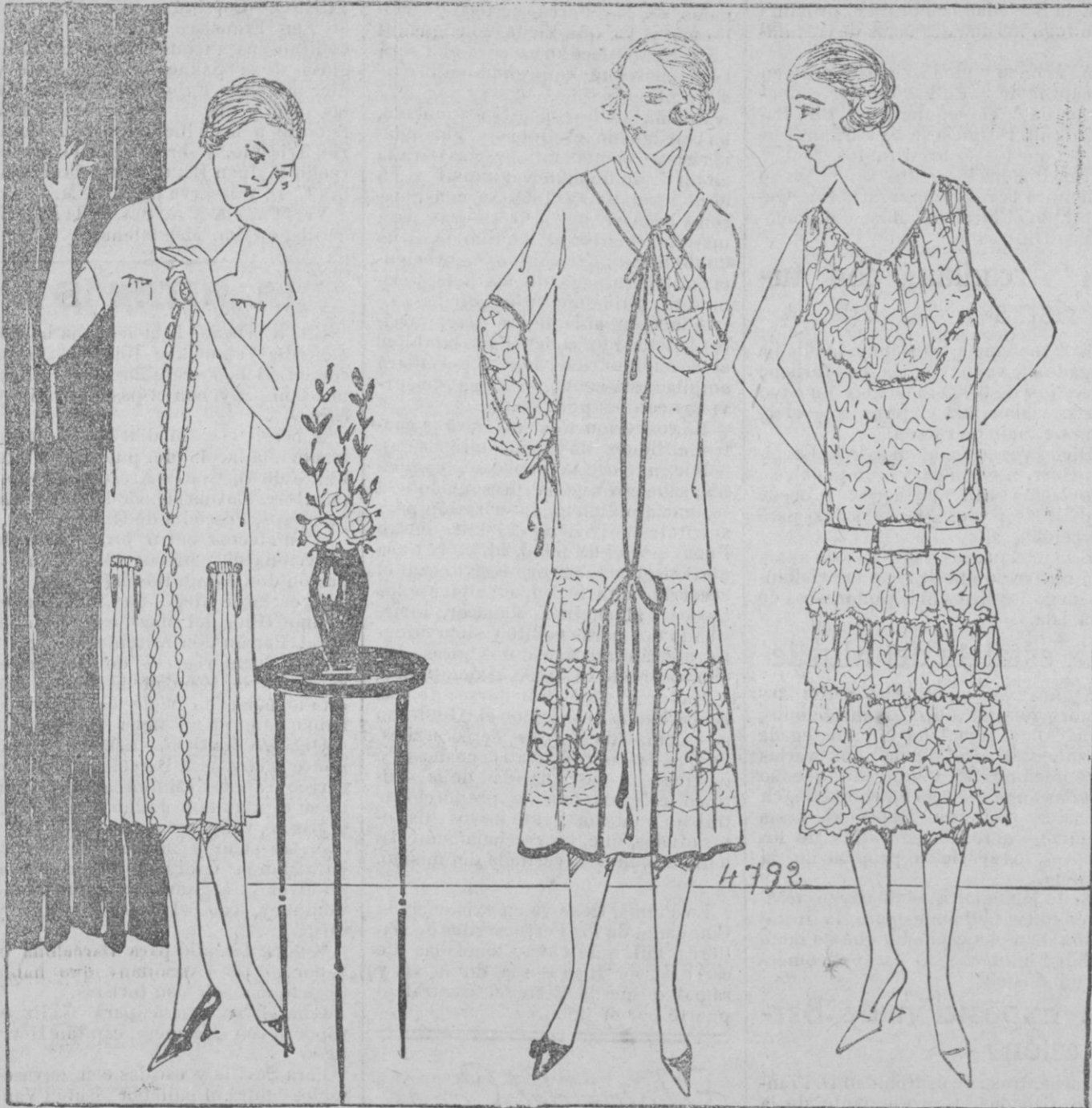
TRAJES EN EL TEATRO.—Una creación de Bechoff, de crepé de china viejo rosa adornado con motivos de plata. Tres pliegues por cada lado retenidos por motivos de plata.—2. Traje de encaje de seda rosa, collar de del mismo tisu, cintura del mismo tono retenida por un cierre de strass; falda con volantes de encaje.—3. Una creación de Philippe et Gaston, traje blanco, de reps, adornado con bordados encarnados, estos serán más echidos en algunos sitios; es adornada con cinta del mismo tono.

Una innovación, es el zapato de noche, no de tisu lame, sino adornado con motivos pintados a mano, la pantufla de Cenicienta forrada se ha enriquecido, sus motivos reproducen el dibujo o el tisu del traje; pronto veremos los zapatos inspirados de los que se ven en San Luis, de trozos ajustados de varios tonos, sobre las tapicerías.