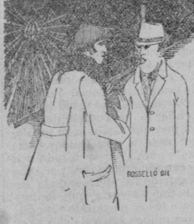
EN LA ESCUELA