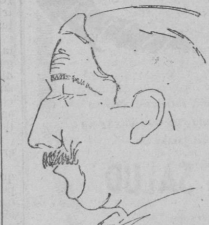
Presidente de la Asociación de Maestros de Baleares y Director de «El Magisterio Balear».