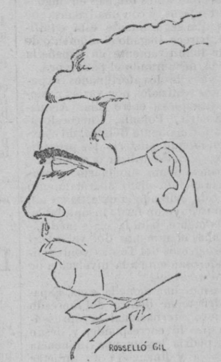
Cultísimo y joven Inspector Provincial de Primera Enseñanza de Baleares.