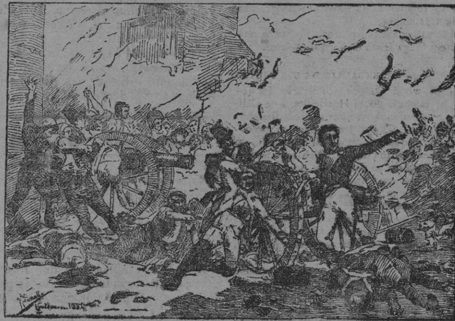
LA DEFENSA DEL PARQUE.—Cuadro de Sorolla.

Abrazáronse a él las mujeres llorando, para contenerle en su loco frenesí... Yo no pude aguantar más. Salí como un rayo. Escaleras abajo sentí tras de mí un golpe de pasos infantiles. Era Polo, que no descendía, sino rodaba de escalón en escalón... Pero no pudo alcanzarme.—B. PÉREZ GALDÓS.