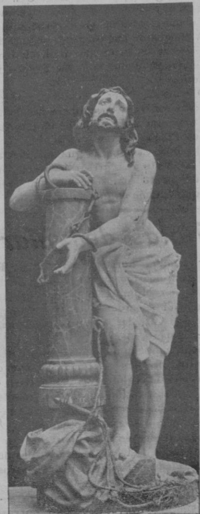
Procesión del Jueves Santo.—Jesús azotado

gias han existido y podrán existir en la sucesión de los tiempos y en medio de las edades y generaciones humanas. Sin embargo, y conviene notarlo bien: aunque el sacrificio de la Cruz sea de infinito valor y suficiente para redimir millones de mundos, no basta por sí solo para nuestros anhelos y para convertir al Cristianismo en la más perfecta de las religiones, en la Religión por excelencia é irremplazable para el hombre. Por más grande que podamos concebirlo, fué un acto pasajero; y nosotros tenemos necesidad de un sacrificio perenne, continuo y que se amolde