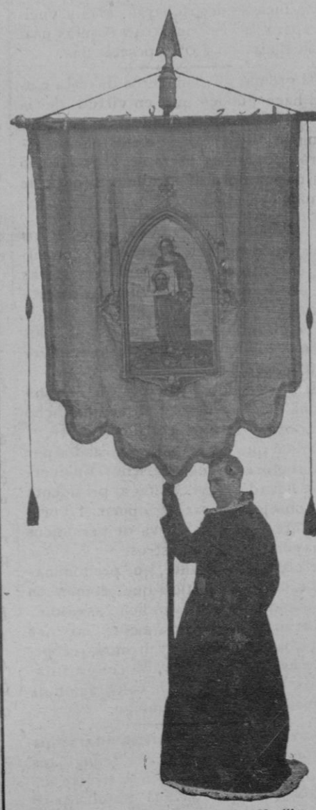
Procesión del Jueves Santo.—Un «Vexilla»

Jesucristo, hombre perfecto, tuvo las tendencias, apetitos y afectos que, sin suponer la culpa, espontáneamente acompañan la naturaleza humana. Aun así, la propia existencia y debía estreñecerse á la sola idea de sentirse arrancar violenta y dolorosamente el alma de un cuerpo que le era tan caro. Vióse esto claramente en la larga oración que hizo en el Huerto de Gethsemani. Allí fué donde, manifestado con todo su vigor este natural y justísimo deseo de la vida, le hizo sentir un horror muy grande á la muerte cercana, horror tan sensible que postrado en tierra el buen Redentor y agonizando y destilando de todo el cuerpo gran copia de sangre, le hizo exclamar en el exceso de su dolor: «Padre, si es posible, alejad de mí este cáliz.»—Mas aquella exclamación fué como una manera de expresar con viveza más imponderable el gran amor que tenía á su mismo Padre. Al momento el corazón generoso de Jesús, Hijo de Dios, añade: «No se haga, em-