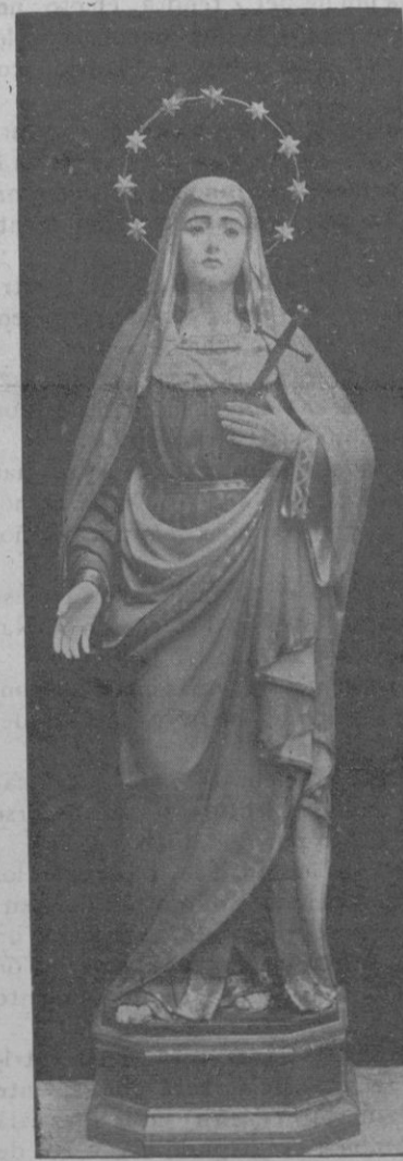
Procesión del Jueves Santo.—Dolorosa

Tales disposiciones autoritarias dictadas—preciso es reconocerlo,—con el más recto y laudable fin, resultan á menudo letra muerta; y muchos de los acompañantes de la figura del divino Redentor, olvidando los respetos que le deben, y hasta los que se deberían á sí mismos, hacen gala de punible desatención y desluen el carácter propio de esa religiosa solemnidad, convirtiéndola en un desfile profano, y á ratos carnavalesco, de abigarrados monigotes. El mal ejemplo trasciende y se comunica á muchos de los espectadores, que se agolpan á ver pasar la procesión; y si se exceptúa el momento so-