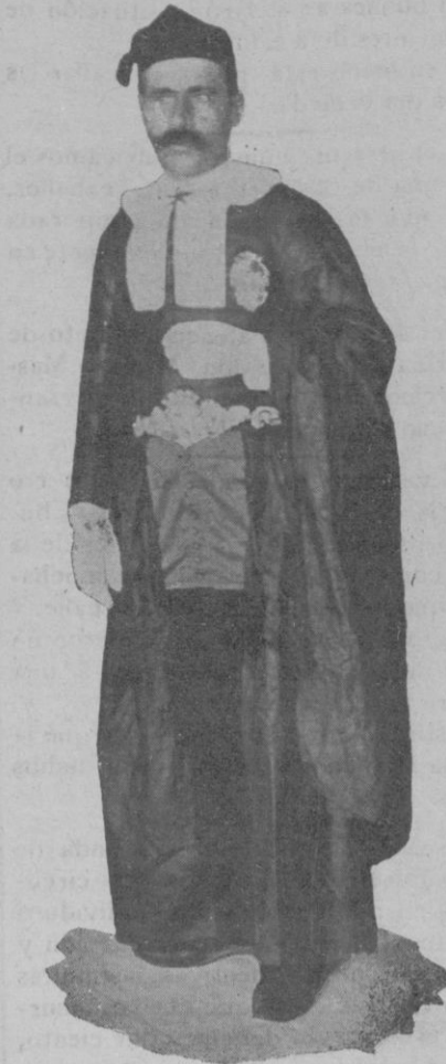
Procesión del Jueves Santo.—Un prohombre de la Sangre

estudiar la sublime arquitectura de la Religión católica, nos parecería obra imperfecta si en ella no viéramos al sacrificio eucarístico como remate y cifra de este monumento de origen superior y divino. Con él, y sólo con él, tenemos medios adecuados para manifestar á Dios nuestra adoración, nuestro culto, lo que el Señor puede exigir de más perfecto á su criatura. Con él no se necesitan múltiples sacrificios, ni substitución de una vida inferior á la del hombre, ni el holocausto de nuestra propia existencia: el mismo Dios-Hombre que nos redimió é infunde la vida sobrenatural, obediente á la palabra inmoladora del sacerdote, substituye con su muerte mística la ofrenda de toda otra vida; lava de continuo las culpas de la humanidad; transforma y dirige al cielo, ennoblecidas y realizadas por infinito valor, nuestras pobres é ineficaces plegarias, y vierte sobre las almas raudales inextinguibles de beneficios y bendiciones. ¿Cómo carecer, pues, de tal sacrificio la Religión destinada á cerrar el círculo de las instituciones religiosas? ¿Cómo faltar este sello de grandeza á lo más noble que cabe concebir para enlazar á Dios con el representante de la creación entera? El Señor no podía dejar sin satisfacción estas legítimas aspiraciones nuestras, y acabamos de entrever por cuán misterioso y altísimo modo las ha realizado. Decir más, parecería ya imposible: sobrepongáanse, pues, el silencio adorador á toda palabra hu-