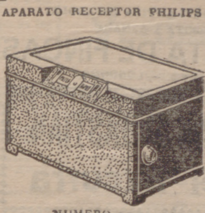
NUMERO 2.511 PHILIPS RADIO