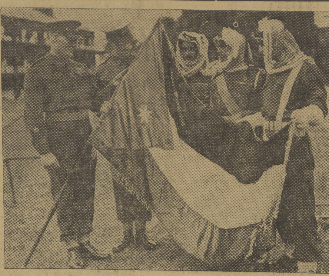
Soldados de la Legión árabe que luchó junto a los aliados entregan una bandera a las tropas británicas en recuerdo de una acción de guerra.

el nuevo edificio recientemente reconstruido por Regiones Devastadas. Por la tarde, el Nuncio Apostólico recibió solemnemente a los delegados extranjeros. Fueron presentados por el señor Ruiz Giménez, presidente internacional de Pax Romana, expresó la alegría de los congresistas por hallarse en casa del representante personal de S. S. al que reiteró la más firme adhesión por parte de todos los afiliados a Pax Romana. Asimismo manifestó el agradecimiento de toda la Junta Organizadora del Congreso, por las facilidades