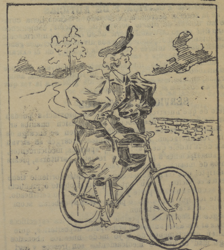
Hoy todo ha cambiado, y ya nuestras bellas lo dejaron todo por la bicicleta.