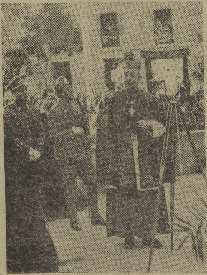
Nuestro Rvdmo. Prelado pronunciando su elocuente discurso después de bendecir la imagen de la Santísima Virgen