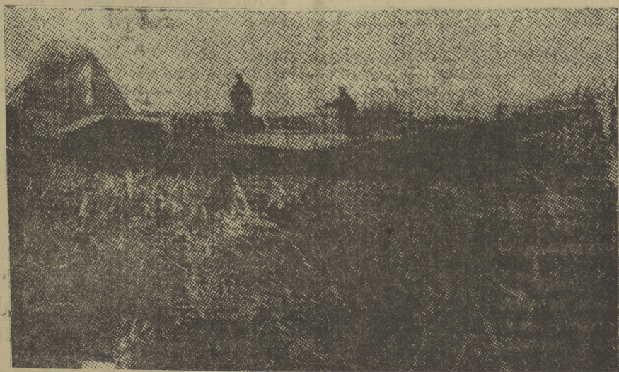
EN EL FRENTE DE MOTRIL.—Un avión «rojo» derribado.

(Información comunicada por Radio Requeté de Málaga).