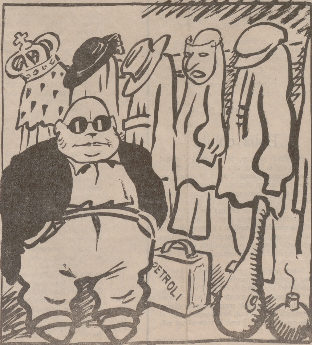
El vestuari del senyor Esteve —Abans d'ahir, de la U. P. ahir de la U. M. N i avui ja no cal dir-ho, republicà, i demà... Sindicaliste?

No hi ha dret a admetre en la República homes com Chapaprieta! No hi ha dret a admetre els seus serveis! No hi ha dret a enorgullir-se de la seva col·laboració!