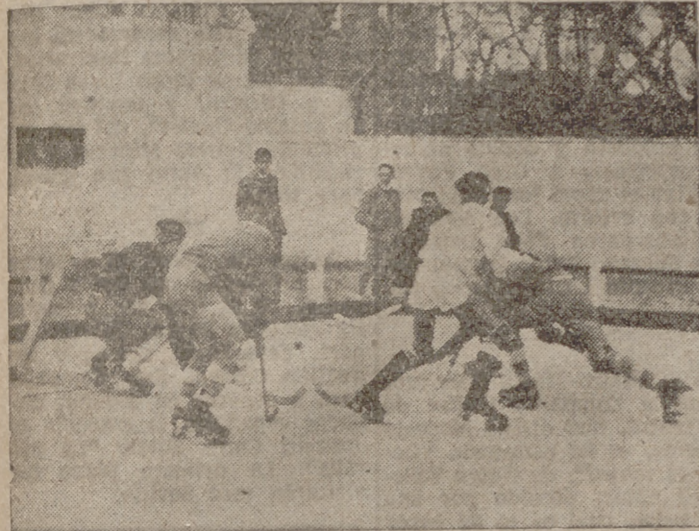
Dos interesantes jugadas del encuentro.