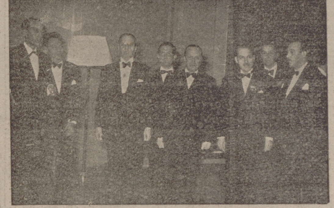
MADRID. — Los ministros Secretario General del Partido y el de Información en el acto de la entrega de los Premios Nacionales de Periodismo y Literatura de la Secretaría General del Movimiento. Los ministros con los cinco galardonados.