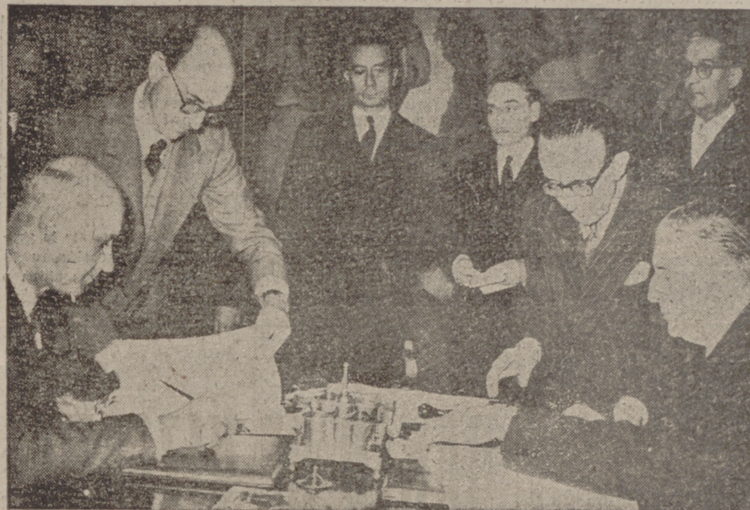
MADRID.—En el Ministerio de Asuntos Exteriores se firmó el nuevo Tratado comercial y de pagos entre España y Francia. El ministro de Asuntos Exteriores, con el embajador de Francia en España, en el momento de la firma del Tratado.