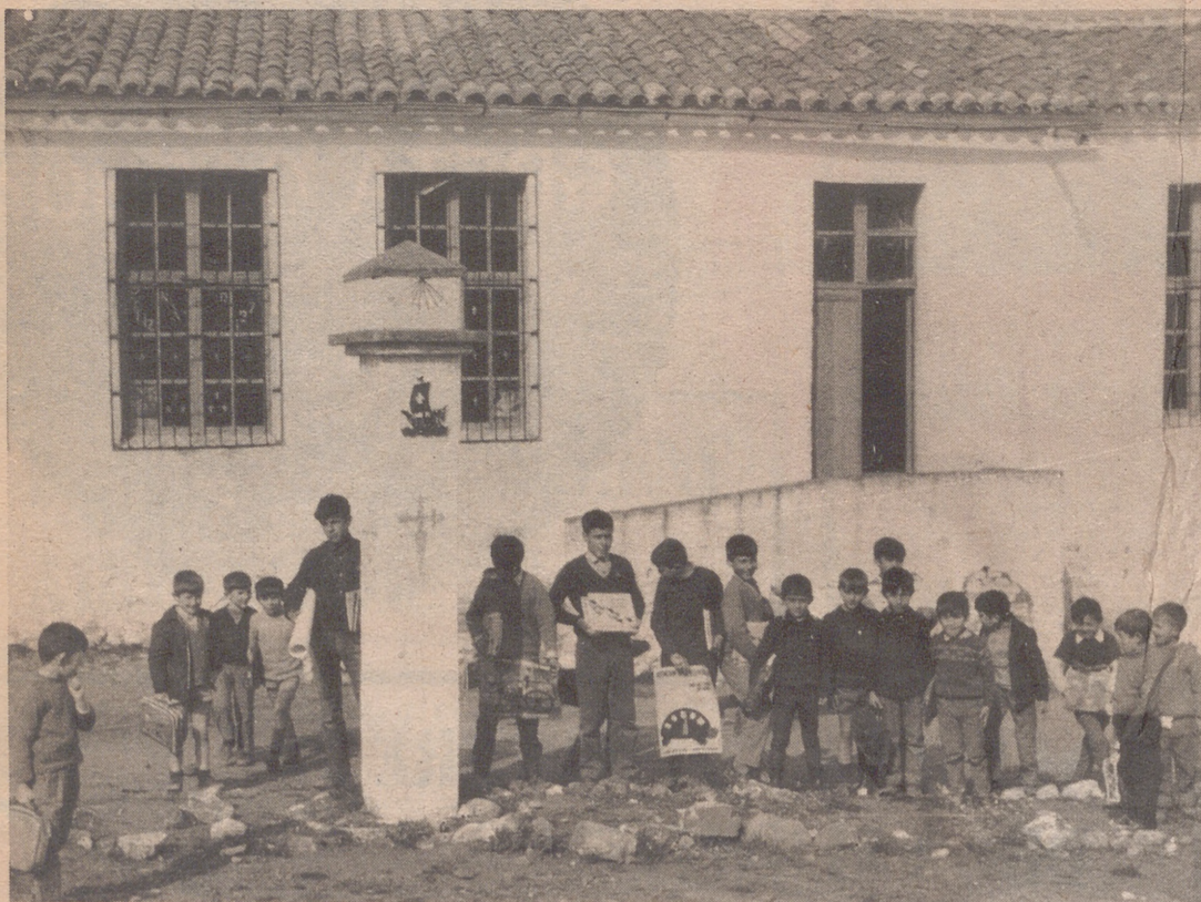
CHILLÓN (Ciudad Real).— La Jefatura Central de Tráfico ha premiado a los alumnos de una escuela de Chillón con lotes de libros, folletos, etc; en un concurso de dibujos convocado sobre circulación y tráfico.