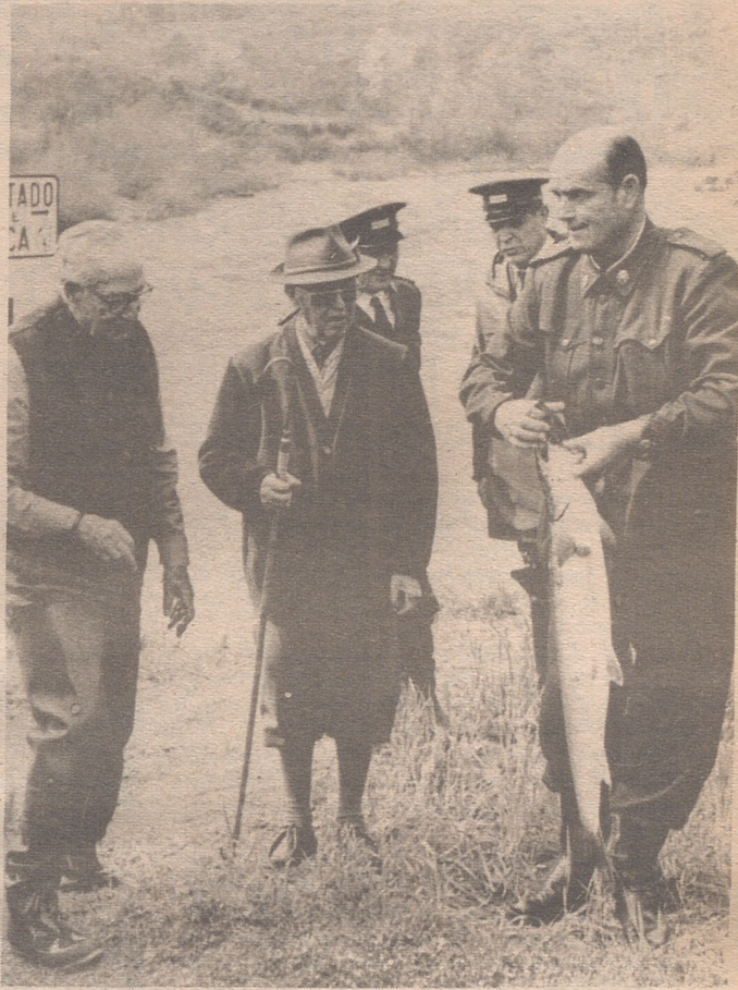
SANTIAGO.— El generalísimo Franco ha pasado la jornada pescando en el coto del Sinde, durante su estancia en tierras de Santiago.