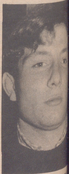
MALLÉN - JUVENTUD

Atención a este joven jugador, no dudamos de que será el futuro del fútbol.