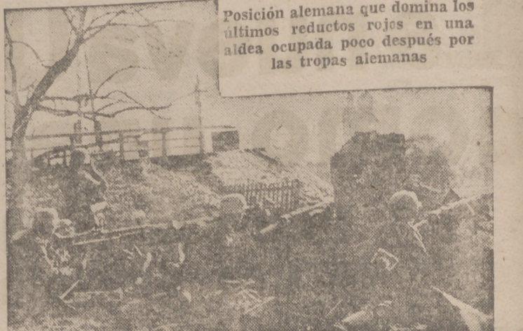
Posición alemana que domina los últimos reductos rojos en una aldea ocupada poco después por las tropas alemanas

Nueva condecoración para premiar actos de guerra en Alemania Berlín, 3.—El Führer Cancellor ha creado una nueva condecoración para premiar los actos de bravura o de aplicación estratégica extraordinarios. La nueva condecoración se llamará Orden de Guerra de la Cruz Alemana y podrá ser en plata y en oro. El "Diario Oficial" da a este respecto los siguientes detalles: Tendrá forma de una estrella octogonal de color gris mate con un borde de plata. En el campo de plata mate irá grabada una corona de laurel de plata o de oro, con una cruz gamada negra con borde de plata. La corona de laurel llevará la fecha de 1941. La condecoración sólo podrá ser impuesta a los militares que se destaquen extraordinariamente por sus éxitos estratégicos, en cuyo caso será en plata, o a los que se distinguen por su valor extraordinario. Como condiciones previas para la concesión de la misma será preciso estar en posesión de la Cruz de Hierro de primera clase del año 1939 o de la guerra mundial o poseer la Cruz del Mérito de primera clase con espadas.—Efe.