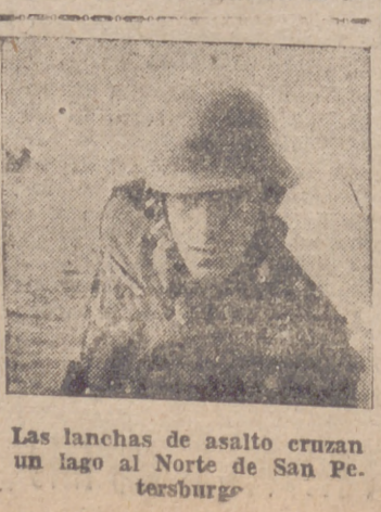
Las lanchas de asalto cruzan un lago al Norte de San Petersburgo

África oriental: Nada importante que señalar.—Efe.