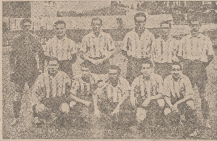
Equipo del Español de Barcelona, que el pasado domingo venció al Atlético bilbaíno y que mañana se enfrentará con el Barcelona

RUFO , el buen medio ala del Valladolid, que a noche llegó a nuestra ciudad y que mañana reaparecerá contra el Arenas