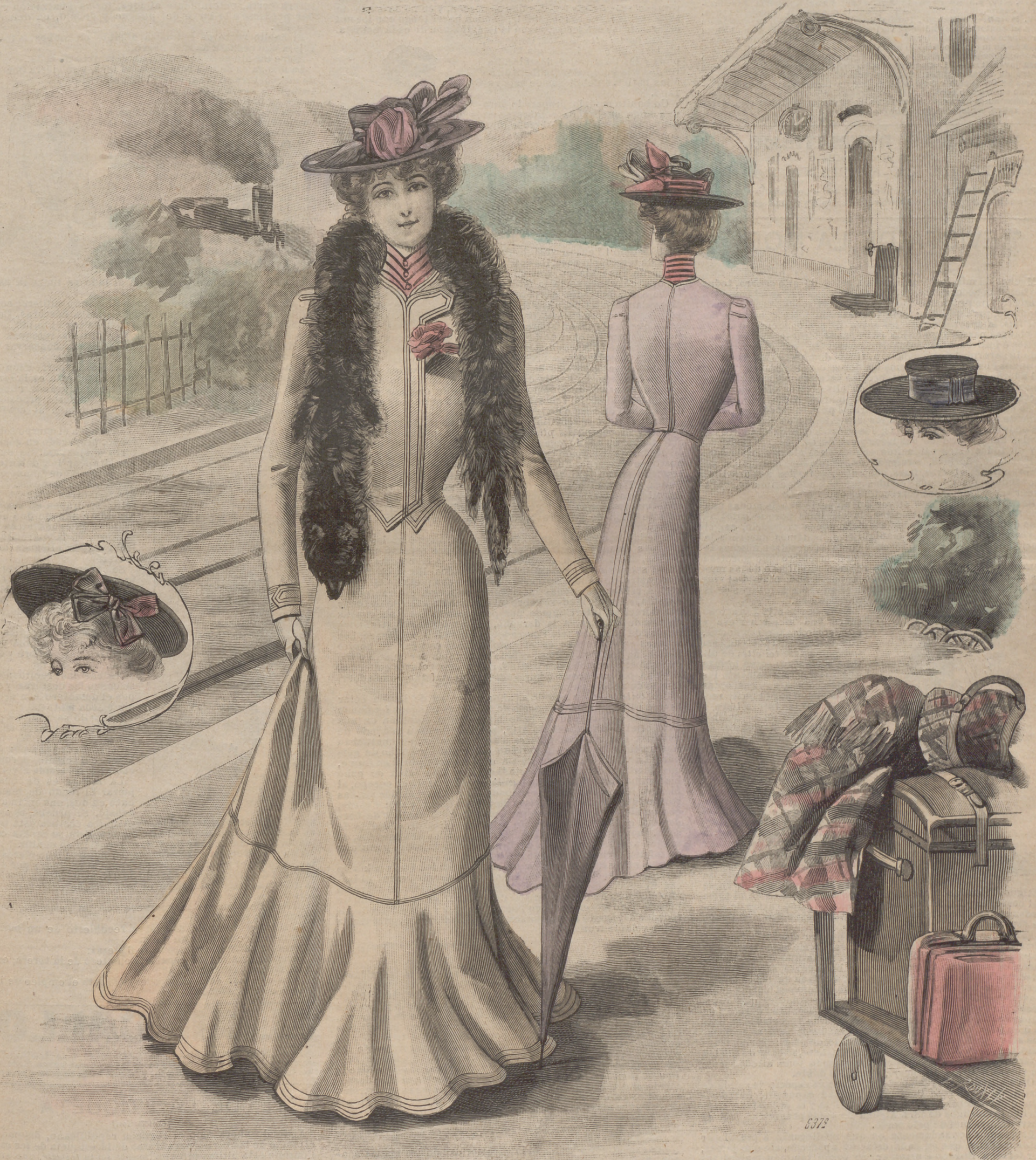
1. Trajes y sombreros alta novedad.

SUSCRIPCIÓN 6 Meses. 1 Año. En toda España. 4 pts. 7'50