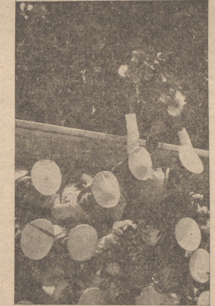
pretó durante la misa algunos motetes.

En el momento de la elevación la Banda de tambores y cornetas, tozó el Himno Nacional. Al terminar la Misa, la masa coral franciscana cantó el Responsorio de Perosi, y el Consiliario de O. J., rezó un responso ante el túmulo, revestido con capa pluvial.