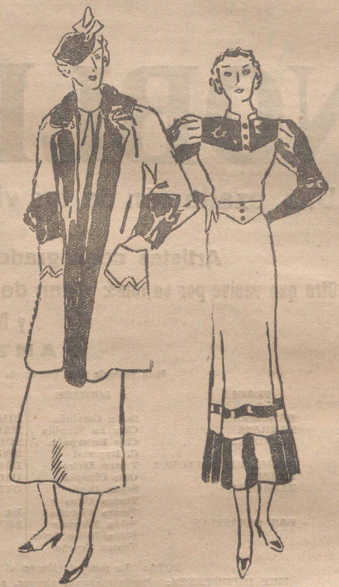
Conjunto de lana mezcla gris azul y beige. El abrigo tres-cuartos está adornado de un gran cuello de piel negra. Grandes solapas de dicha piel, que se prolongan hasta el borde de la chaqueta. — Traje de lana adornado de terciopelo negro, formando canesú. Las mangas pegadas con pinzas interiores, y dos bandas en la parte inferior de las mangas. Cuello recto bordea el escote.

En este orden de ideas, pueden crearse diversos estilos de decoración de interiores, que respondan a la afición predilecta del dueño de casa.