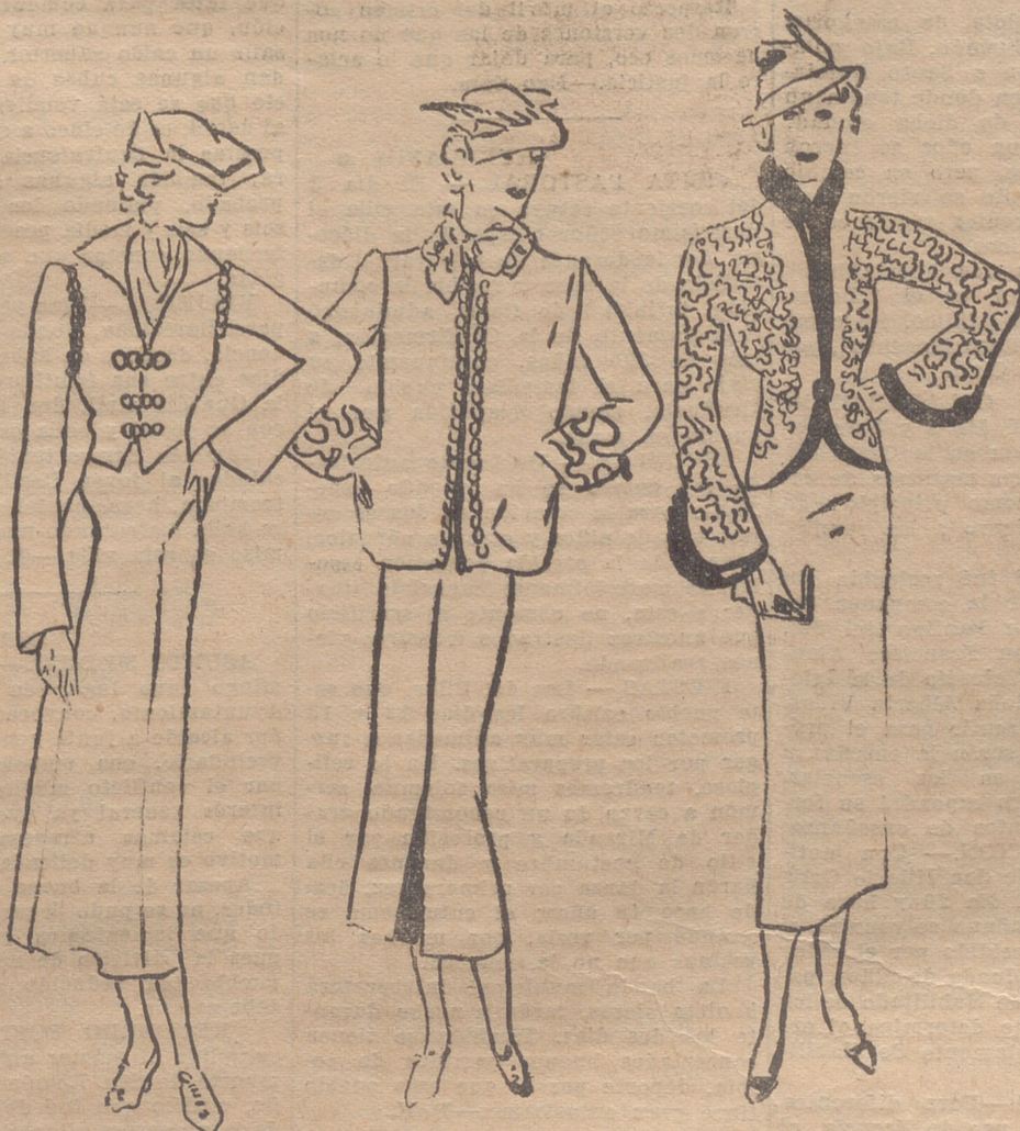
Traje sastre de lana oscura. Efecto de chaleco delante, que se termina por dos puntas en el talle. Se cierra por tres cadenas de "soutache" tabaco claro. El mismo "soutache" adorna el principio de las mangas. El cuello, abierto, formando dos solapas, está formado de duvetina color calabaza. — Traje sastre de lana gris azulada claro. Cuello, bocamangas y parte delantera de la chaqueta están adornados con "soutache" marrón. La falda se lleva con una blusa de crepón marrón. — Traje sastre de lana fina, verde oliva. La chaqueta, redondeada por delante, está completamente bordada de "soutache" negro. El cuello, así como todo alrededor de la chaqueta y las bocamangas están bordeados de nutria.