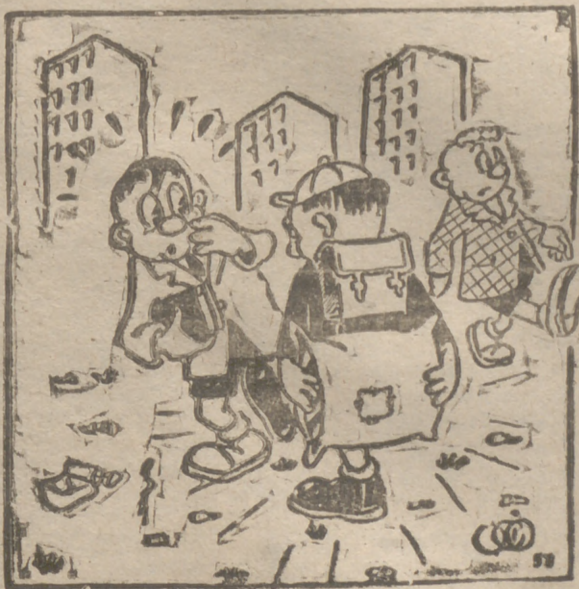
— Dice mi madre que estas botas son muy resbaladizas...!