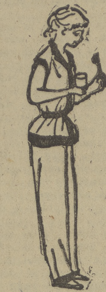
¡Pijama con cinturón. Otomán blanco; cinturón y vueltas en azul marino o rojo; pantalón largo y vueltas también en color.