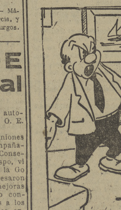
—¡Ahí tienes a los de González, que el sueldo le llega, por lo menos, hasta el día 12...!