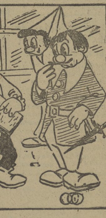
—Ahora vamos a ensayar el mutis rápido, por si acaso...

Envío: A los "actorazos" de Pucela, con todo afecto. Por OGIO