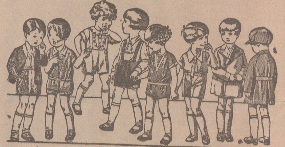
Diversidad de modelos en trajes para niños en punto, drill, lana o pana, de 5 a 15 años.

Casa Munguía () Plaza Mayor, 48 y Lain Calvo, 5 Sucursal: Plaza Mayor 5 BURGOS. Primera casa en confecciones para caballero, señora, jóvenes y niños. Tejidos, Pañería y Sastrería