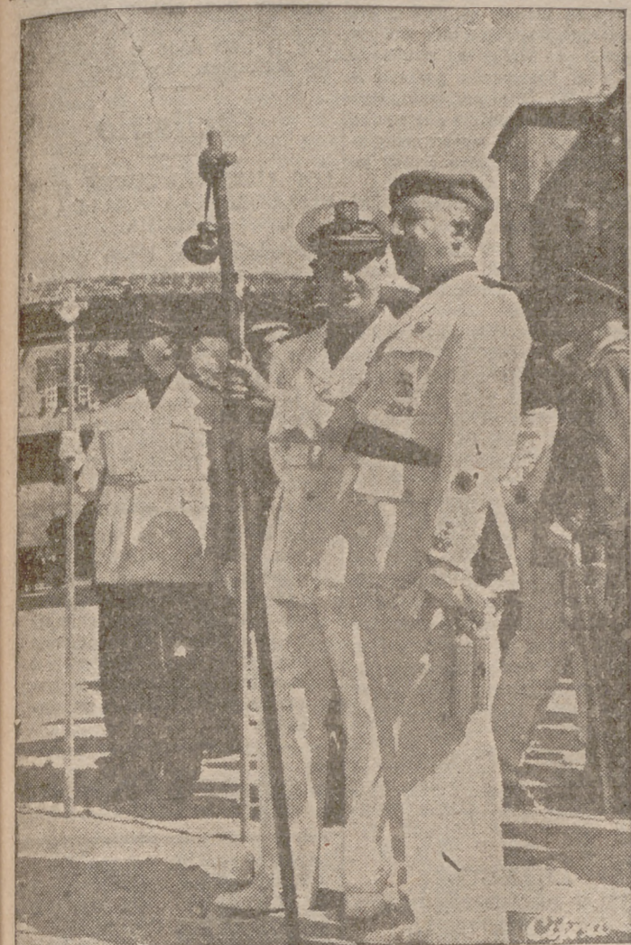
El Caudillo, con su bordón de peregrino y acompañado del ministro secretario general del Partido, presencia la concentración de los peregrinos de la Falange ante la Catedral de Santiago, en la que entró al frente de ellos para rendir homenaje al Apóstol.