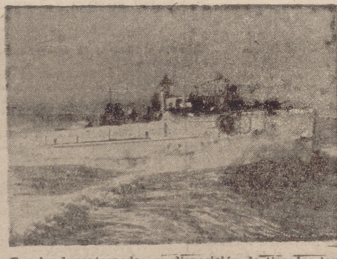
Con los lanzatorpedos en disposición de tiro, las lanchas rápidas alemanas surcan las aguas en busca del enemigo.