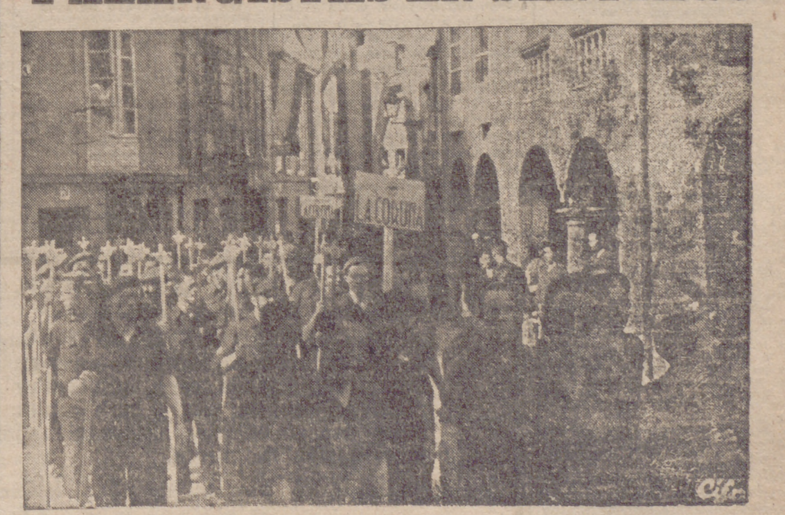
Un detalle de la peregrinación de la Falange al dirigirse a la Catedral de Santiago para postrarse ante el Apóstol, presidida por el Caudillo.