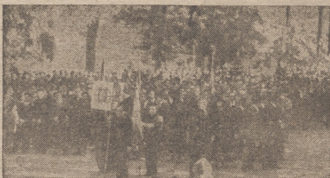
Los productores de la C. N.S. concentrados en el Paseo Alto de las Moreras

Y desde las primeras horas las calles se veían en extremo animadas. En correctos desfiles marchaban los Sindicatos y camaradas de las Milicias y de las Organizaciones Juveniles hacia el paseo alto de las Moreras, donde varios actos habían de tener lugar.